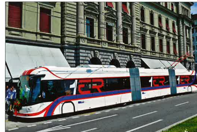
An der Zwischenendstelle Luzernerhof zeigt sich deutlich die markante Beschriftung als neuer „Einser“.

Die Traktionsbatterie wird während des Fahrgastbetriebs durch die Oberleitung im sogenannten „In-Motion-Charging“-Verfahren (IMC) geladen. Dies erfolgt automatisiert, so dass kein Personal für den Ladevorgang aktiv werden muss. Die automatischen Stromabnehmer der neu entwickelten Serie OSA 550 ermöglichen nicht nur den Wechsel zwischen