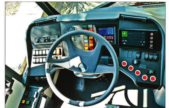
Der Fahrerarbeitsplatz im neuen Fahrzeug mit seinen Bedienelementen für die fünf Türen

Eingesetzt werden die neuen Fahrzeuge ausschließlich auf der Linie 1 zwischen Kriens-Obernau und Maihof. Ein neuartiger Auftritt in Form eines außen am Wagen, in den Sitzbezügen, auf Verkleidungen und dem Wagenboden sowie an den Haltestellen zu findenden Logos soll die enorme Bedeutung dieser frequenzstärksten Linie des öffentlichen Verkehrs im Kanton Luzern unterstreichen. Mittelfristig ist ein Einsatz von Doppelgelenk-Trolleybussen auch auf den Linien 2 Luzern Bahnhof-Emmenbrücke