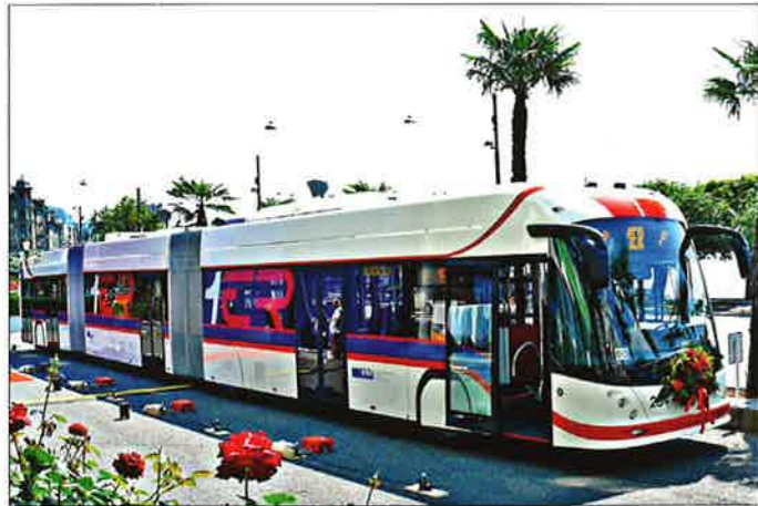
Bei strahlendem Sonnenschein wurde am 12. Juni 2014 der erste neue Trolleybus der Serie 234 bis 242 vor dem Hotel Schweizerhof mit Feuerwerk, Musik und Blumenschmuck präsentiert.

Am 12. Juni 2014 wurde den Medien und der Öffentlichkeit der erste neue Doppelgelenk-Trolleybus vom Typ HESS/Vossloh-Kiepe lighTram 4 BGGT-N2D präsentiert. Die Verkehrsbetriebe Luzern (vbl) haben zunächst neun dieser Fahrzeuge, die als Nummer 234 bis 242 eingereiht werden, zum Preis von 1,4 Mio. CHF pro Stück (etwa 1,16 Mio. EUR) bei der im solothurnischen Bellach ansässigen Carrosserie HESS AG in Auftrag gegeben. Begonnen hat dieser Beschaffungsprozess mit der Ausschreibung der ersten neun Fahrzeuge, deren letztes spätestens am 15. Dezember 2014 einsatzbereit sein muss, im Oktober 2012. In der Ausschreibung enthalten sind Optionen für acht (einlösbar bis 31. Juli 2016) und zehn (einlösbar bis 31. Juli 2020) weitere Wagen. Daraufhin fanden Anfang Dezember 2012 auch Probefahrten mit einem Van Hool ExquiCity in Luzern statt, der sich gegen die Konkurrenz aus dem Hause HESS aber dort nicht behaupten konnte. So bekamen die Bellacher Karosseriebauer dann im März 2013 auch den Zuschlag für diesen Auftrag.