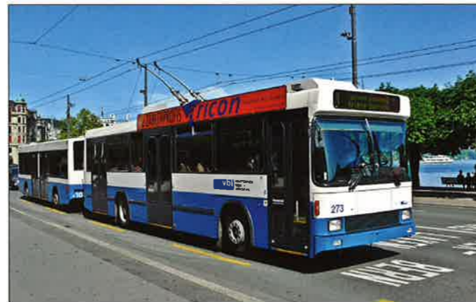
Nach 25 Jahren droht den 1989 in Betrieb genommenen Hochboden-Trolleybussen NAW/Hess/R&J/Siemens BT5-25 das Aus. Ein Teil der nun nicht mehr benötigten Fahrzeuge wird nach Chile abgegeben, die elf Niederfluranhänger 301 bis 311 der ersten beiden Serien stehen zum Verkauf. Hier ist Wagen 273 mit Anhänger 303 auf dem Schweizerhofquai in Richtung Kriens unterwegs.

Fünf LED-Zielanzeigen, davon je eine an Front und Heck sowie drei an der rechten Fahrzeugseite, informieren allesamt über die Liniennummer