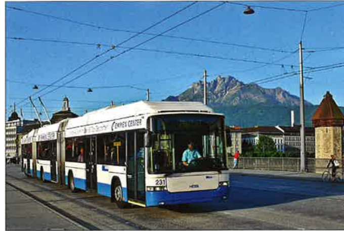
Die ersten drei Doppelgelenk-Trolleybusse vom Typ BGGT-N2C gingen 2006 in Luzern unter den Nummern 231 bis 233 in Betrieb. Hier ist Wagen 231 vor der Kulisse von Kapellbrücke und Pilatus in Richtung Maihof unterwegs.

tal-Freiamt aus dem luzernischen Hochdorf, BSF, im Einsatz seit März 2014).